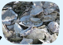
積まれたかき殻。塩分を除くため1年以上雨ざらしに