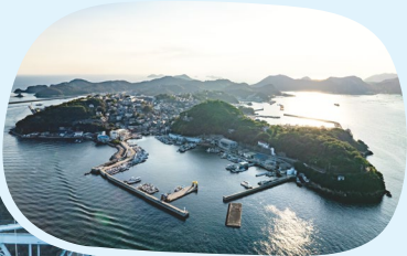
坊勢島北部に位置する坊勢漁港