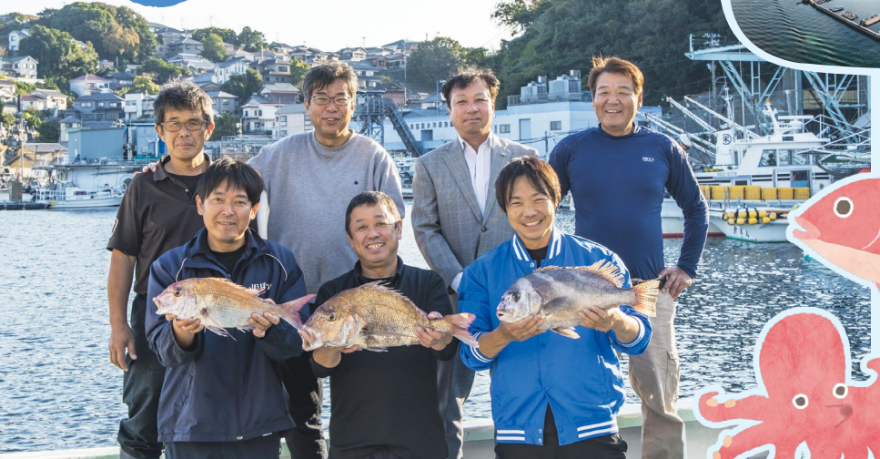
坊勢漁協と兵庫県漁連の職員、漁師のみなさん