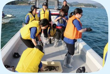
海藻の一種「アマモ」の種を放流。群生すると魚が産卵しやすく、稚魚が育ちやすい「海のゆりかご」に。

2020年に産直提携。波が穏やかで水質がよい虫明(むしあげ)湾で、大粒でふっくらとしたかきを養殖しています。豊かな海を守るため、海の生きものすみかとなる藻場の再生に取り組んだり、かき殻を米栽培の肥料にしたりするなど、環境に配慮した活動を展開。2024年10月には組合員が訪問し、生産者と交流しながら産地への理解を深めました。