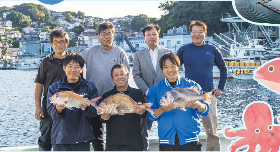
坊勢漁協と兵庫県漁連の職員、漁師のみなさん