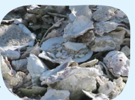
積み重ねたかき殻。塩分を除くため1年以上雨ざらしに

2020年に産直提携。波が穏やかで水質がよい虫明(むしあげ)湾で、大粒でふっくらとしたかきを養殖しています。豊かな海を守るため、海の生きものすみかとなる藻場の再生に取り組んだり、かき殻を米栽培の肥料にしたりするなど、環境に配慮した活動を展開。2024年10月には組合員が訪問し、生産者と交流しながら産地への理解を深めました。