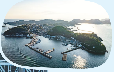
坊勢島北部に位置する坊勢漁港