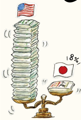
日本のパンの原料小麦はアメリカ、カナダ、オーストラリア産がほとんど。

米に並ぶ主食のパン。しかし、自給率がほぼ100%の米に対し、 パン用小麦の自給率はたったの「8%」 。圧倒的な生産量があって品質を安定させやすい外国産小麦に対して、国産小麦はなかなか広がっていません。