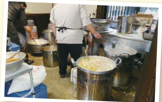
自らも被災しながら、地元の料理人が炊き出しに協力。