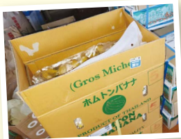
生鮮食品が手に入りにくいので、果物はとても喜ばれました。