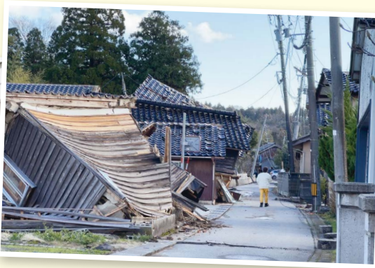
倒壊した家屋とそうでない家屋が隣接しているケースがたくさん見られ、それが印象的でした。