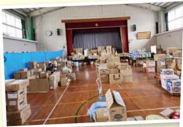
支援の拠点となった廃校。物資の保管や宿泊に使われました。

よりよい地域づくりのために住民や行政と連携して活動。地震や台風などの被災地支援も行っています。