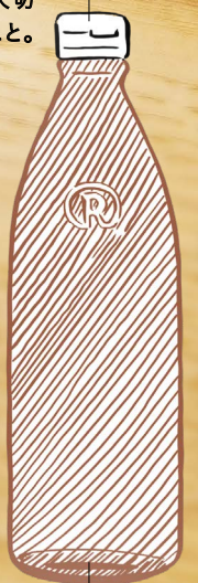
“茶色いびん”も対象です

リユースするうえでいちばん大切なのは「びんを傷つけない」こと。無理に外す必要はありません。