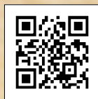
リユースびん商品の一覧はこちら

続が危ぶまれる状況です。近年燃料費の高騰などで新しいびんの生産コストは大きく上昇しています。リユースこそ地球環境を守る、未来につながる選択です。