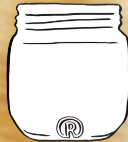
ジャムびんの回収率はたったの58.2% (2023年度)

紙のラベルを無理にはがそうするとびんを傷つける原因に。スルトとはがれない場合はそのまま戻してください。