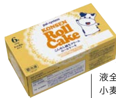
「こんせん純生クリームロールケーキ」の原材料表示

液全卵（鶏卵（茨城県産））、生クリーム、砂糖、小麦粉（小麦（北海道産））、液卵白、米油、牛乳、水あめ、還元水あめ、なたね油、粉砂糖（砂糖、コーンスターチ、加工油脂）／乳化剤（グリセリン脂肪酸エステル、ソルビタン脂肪酸エステル、シロ糖脂肪酸エステル、プロピレングリコール脂肪酸エステル）