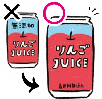
着色料や、着色料の役割をする原材料・添加物が使われていない場合

消費者庁の「食品添加物の不使用表示に関するガイドライン」で、禁止事項に該当する可能性がある10の類型が示されました。単に「無添加」「不使用」とパッケージに表示することは、消費者を誤認させる可能性があり、「何が無添加なのか」を明確にする必要があります。パルシステムでも、ガイドラインに沿ってパッケージ内容を見直し、対応を進めています。