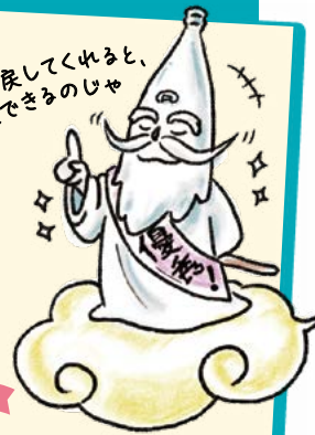
リユースびん仙人