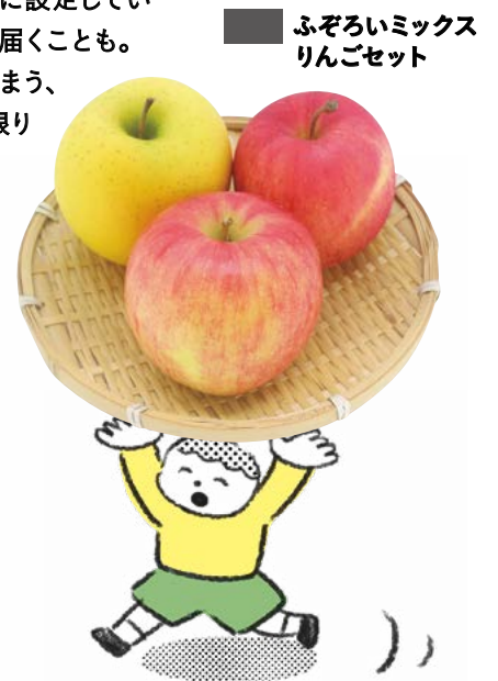
■ ふぞろいミックスりんごセット