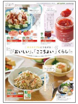
同時配付の別チラシも併せてご覧ください。

日々の小さな「ちょい活」を積み重ねて、食品ロス削減につなげていきませんか? ※農林水産省令和2年度推計値