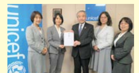
日本ユニセフ協会での贈呈式