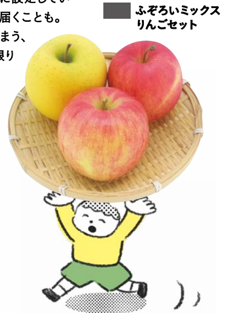
■ ふぞろいミックスりんごセット