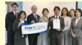
ピースポート災害支援センターでの贈呈式

今年2月のトルコ・シリア地震発生を受け、緊急支援募金を呼びかけた結果、組合員のみならず多くの支援をいただきました。募金は現地で支援活動を行う7団体に寄贈し、物資支援や教育の再開、被災者の心のケアなどの費用として活用されます。