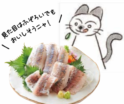
■ ふぞろいの刺身用真あじ

青果は出荷基準を市販品よりもゆるやかに設定しているため、大きめのものや小さめのものが届くことも。水産品を加工するときどうしても出てしまう、部位やサイズがふぞろいなものもできる限り商品化しています。