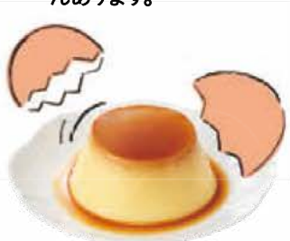
■ カスタードプリン 85g × 3 ■ 茎が長めのブロッコリー ■ カスタードプリン 85g × 6