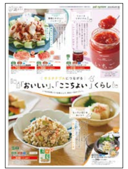
同時配付の別チラシも併せてご覧ください。

日々の小さな「ちょい活」を積み重ねて、食品ロス削減につなげていきませんか? ※農林水産省令和2年度推計値