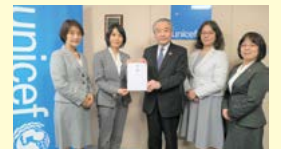
日本ユニセフ協会での贈呈式