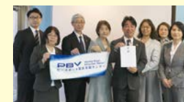
ピースポート災害支援センターでの贈呈式

今年2月のトルコ・シリア地震発生を受け、緊急支援募金を呼びかけた結果、組合員のみならず多くの支援をいただきました。募金は現地ですべての支援活動を行う7団体に寄贈し、物資支援や教育の再開、被災者の心のケアなどの費用として活用されます。