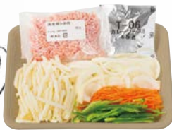
■ 細切りじゃがいもと豚ひき肉のカレー炒めセット