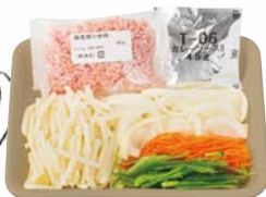
■ 細切りじゃがいもと豚ひき肉のカレー炒めセット