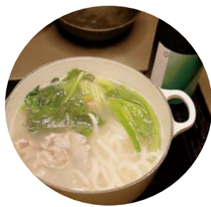
鍋料理なら調理時間も家族とじっくり過ごせる

ません。鍋やホットプレートを使って食卓で仕上げる料理なら、その待ち時間も「ちそう」です。