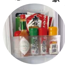
定番調味料は冷蔵庫の扉に

にしまい込まず壁にかけて見えるようにする、フライパンや包丁など自分用の「マイ器具」があってもいいですね。うちの冷蔵庫は、夫が好む定番調味料をわかりやすい位置にしまっています。料理に参加するハードルを下げ、それだけの家庭でできる、さりげない工夫でいいと思いますよ。