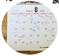
年末には家庭内のタスクをここで共有

フリーライターだった私は結婚後も仕事を続けていましたが、夫は仕事で帰宅が遅く、家事や子育てはひとりで担う「ワンオペ」状態。「なんで私ばかり」って思っていました。そういう気持ちになるのは、家事の労力がほかの家族には見えづらくて、その大変さが伝わりにくいからなんですよね。