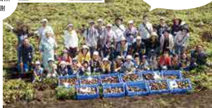
大牧農場 (北海道) での産地交流