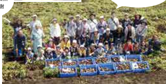
大牧農場(北海道)での産地交流