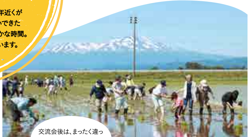
庄内産直ネットワーク (山形県) での産地交流