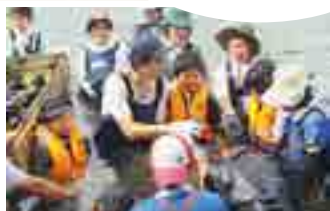
大隅地区養まん漁業協同組合 (鹿児島県) での放流モニタリング調査