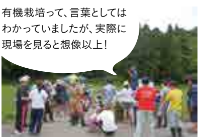
有機栽培って、言葉としてはわかっていましたが、実際に現場を見ると想像以上! JAささかみ (新潟県) での田んぼの生きもの調査 ※交流写真は2019年以前のもので