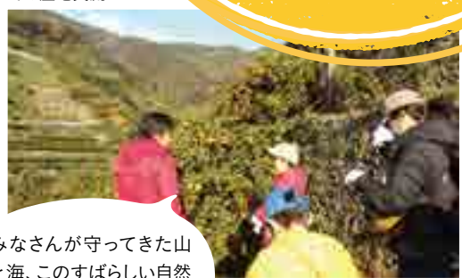
みなさんが守ってきた山と海、このすばらしい自然があることに改めて感謝