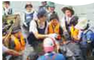
大隅地区養まん漁業協同組合(鹿児島県)での放流モニタリング調査