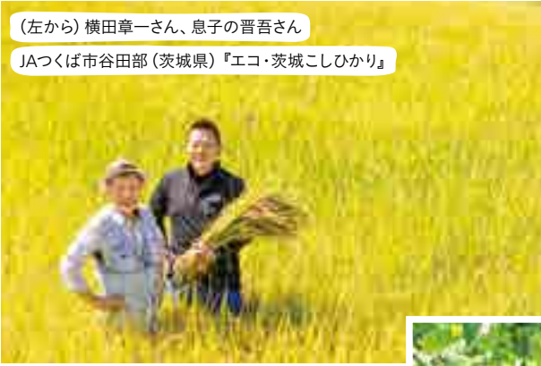
JAつくば市谷田部(茨城県)『エコ・茨城こしひかり』