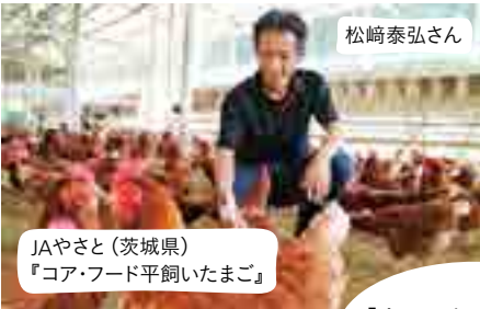
JAやさと(茨城県)『コア・フード平飼いたまご』