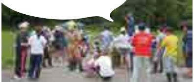
JAささかみ(新潟県)での田んぼの生きもの調査