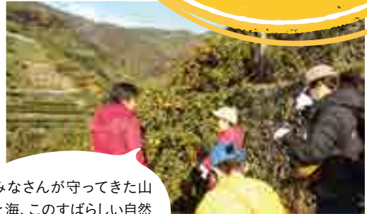
無茶々園(愛媛県)での産地交流

食糧を選ぶことは作り手へのメッセージ。おいしい、もっと食べたい、という思いは毎日の「たべる」を通して確かに作り手へと伝わっています。「つくる」と「たべる」が支え合う、それがパルシステムの産直です。