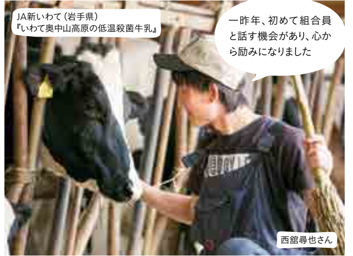
JA新しいわて(岩手県)『いわて奥中山高原の低温殺菌牛乳』