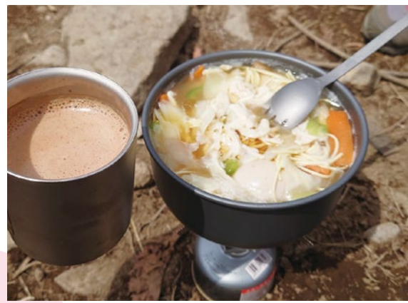
山ごはんのラーメン鍋。山頂で食べると格別においしい。

自他ともに認める山好き。他県の山をめざして、山登り仲間の息子といっしょに、休日に出かけるのが楽しみでした。ブームになっている「山ごはん」にも凝り始め、道具をいろいろ集めたところ。再開したときに息子に情けない姿を見せまいよう、体づくりに励んでいます。