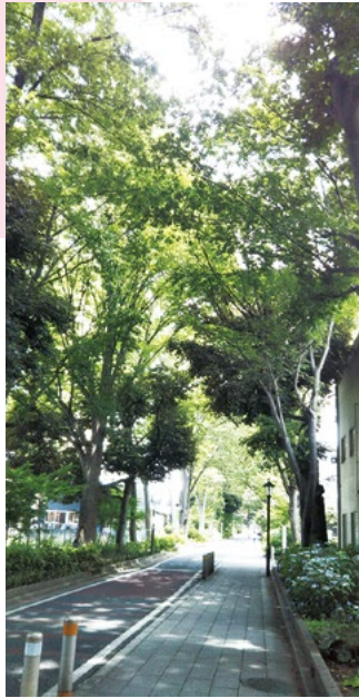
立派なけやきが並ぶ散歩道。