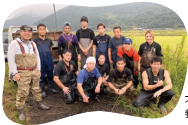
大隅地区養まん漁協の 養殖生産者

1口100ポイントが「大隅うな ぎ資源回復協議会」の活動の 応援募金に。注文用紙に6桁 番号 190969 と口数をご記入 ください。