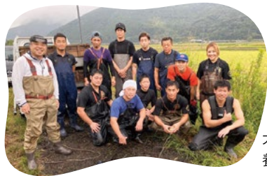
大隅地区養まん漁協の 養殖生産者

1口100ポイントが「大隅うな ぎ資源回復協議会」の活動の 応援募金に。注文用紙に6桁 番号 190969 と口数をご記入 ください。