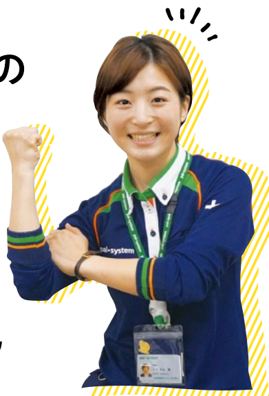
パルシステム東京 狛江センター