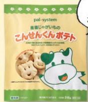
『産直じゃがいものこんせんくんポテト』