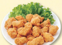
『までっこ鶏ミニ唐揚げ』

お料理セットで作ったものや揚げ物、副菜など、夕食のおかずを1回分ずつミニタッパーに冷凍。「朝は解凍して詰めるだけ」方式で楽に作れています! パルシステムの冷凍食品も活用しています。 (COOCさん/4歳)