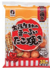
「大阪生まれのま〜るしたこ焼き」