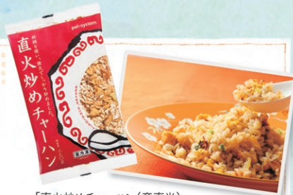
「直火炒めチャーハン(産直米)」