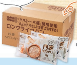
「内麦クロワッサン」