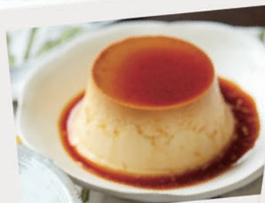
あじ: けっこう甘く感じた かたさ: しっかりかため