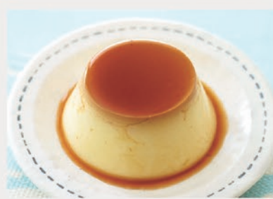
あじ: 卵の味がした! かたさ: かため。プルプルしてない