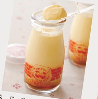
あじ: すこし甘さひかえめ かたさ: かたいけど、なめらか