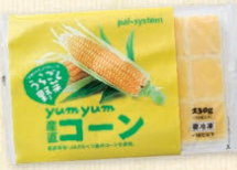
『yummyum 産直うらごしコーン』

何と言っても「うらごし」シリーズ! 忙しい朝でも解凍してすぐ離乳食が作れるし、食べにくそうな野菜もこれであればとパクパク食べられます。うらごし野菜シリーズは全種類ストックしています!