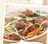
調理時間約5分というのも気に入っています!