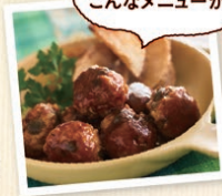
『きのこ入りミートボール』