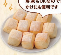
『北海道牛乳仕込みのミルクパン』