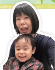
パルシステム神奈川ゆめコープ/Yさん、Hくん(2歳4カ月)

注文は通勤中にスマホやタブレットで済ませます。インターネットで注文しつつ、買物がマンネリになりがちときは注文アプリ「webカタログ」でカタログの表紙や特集などを見ることも。チラシもチェックできていいですよ! あとは冷蔵庫管理にアプリ「まめパル」を使っています。野菜や冷凍食品の残りが分かって、無駄な買い物をしなくて済むようになり助かっています。