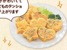
『星とハートのオムレツ(野菜・チーズ入)』