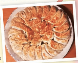
餃子の皮を いっしょに包むと、 なぜか会話が スムーズになることも