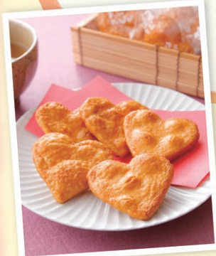
渋いけど、かえて “おとなのバレンタイン”感が ある!?

夫はチョコレートやクッキーが嫌いなので、私の気が向いた年にせんべいをあげています。プレゼント用のせんべいは種類が少なく、選ぶのも探すのも面倒なので、あげない年も。(N.K.さん(女性)/結婚5年目)