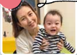
みなとママさん みなとくん (9カ月)

離乳食が始まって、いろんなものを食べるようになったらうんちの様子や回数が変わって、おしりが荒れやすくなりました。小児科でおむつかぶれのお薬をいただいてケア中。