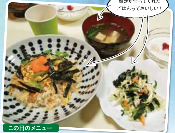
この日のメニュー 五目ちらしずし/サラダ/みそ汁/バナナヨーグルト

近くの老人介護施設で行われている“ごはん会”に。ご近所さんや入所している方とゆったりごはんを食べます。子どもも楽しく食べられるし、私も夕食作りをお休みできる、月1回のお楽しみです。