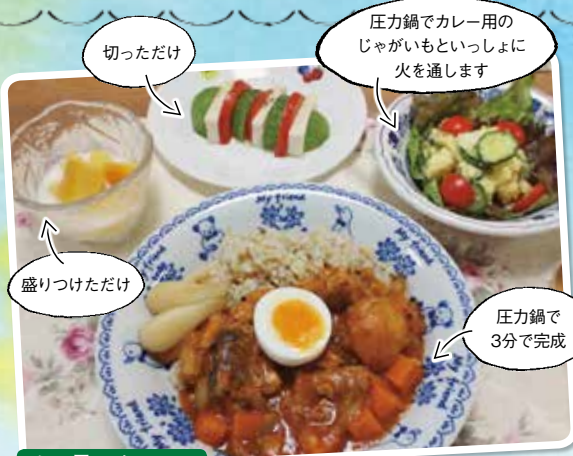
この日のメニュー ごろごろ野菜のさば缶カレー/ポテトサラダ/アボカドと豆腐&トマトのオリーブオイルがけ/マンゴーヨーグルト

幼稚園の帰りに娘の外あそび→帰宅後はお風呂→すぐ夕食、とあわただしいわが家。短時間で仕上がる圧力鍋は強い味方です。この日は圧力鍋で火を通した野菜とジュース、カレー粉を煮て、仕上げにさば缶を入れた時短カレーに。