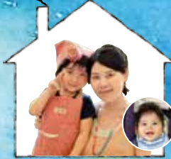
パルシステム東京 Y.O.さんと Yちゃん (4歳)、 Nくん (5カ月)