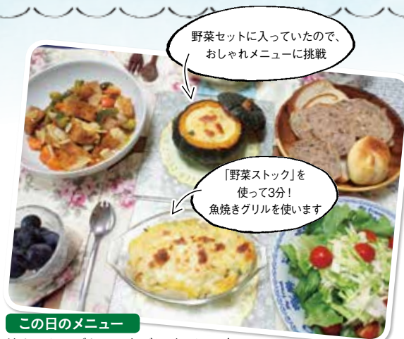
この日のメニュー 坊ちゃんかぼちゃの丸ごとグラタン/ドリア/サラダ/厚揚げの甘酢あんかけ/パン/ぶどう

夜は子どもといっしょに8時に寝てしまうので、食事作りは朝まとめて片付ける派。蒸し野菜などを作って置いて、夜はホワイトソースとあえて焼くだけに。味付け薄めの「蒸し野菜ストック」はアレンジがきくので重宝します。