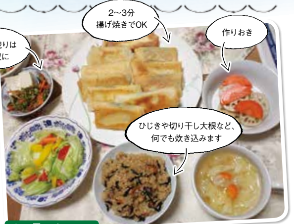
この日のメニュー 豆腐としそチーズ春巻き/炊き込みごはん/野菜スープ/サラダ/にんじんとれんこんの甘酢漬/セロリとにんじんのきんぴら

スライスしたもめん豆腐としそ、スライスチーズを包む「豆腐春巻き」。手軽で食べごたえ◎! たくさん食べるわが家の定番です。火もすぐ通って調理時間も短い、おすすめです♪ ごはんは炊き込みにして、バランスアップ。