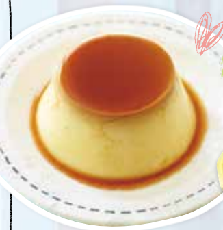
「カスタードプリン」