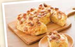
「豆腐でしっとりおかずパン」

4歳の子どもとホットケーキミックスを使っておやつ作り。卵を割る、混ぜる、生地を流し込む、ひっくり返しをやってもらいます。（かたつぼさん）