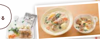
「ミートボールと野菜のクリーム煮セット」