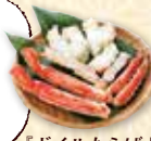
『ボイルたらばガニ ハーフポーション』

実家への土産には必ずパルシステムの冷凍のカニを持って行きます。解凍も簡単で食べやすく、お正月の食卓には欠かせないと喜ばれています!