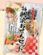
『パルシステムでお馴染みおせち(7品)7種』

実家への土産には必ずパルシステムの冷凍のカニを持って行きます。解凍も簡単で食べやすく、お正月の食卓には欠かせないと喜ばれています!