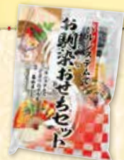
【パルシステムでお馴染みおせち (7品) 7種】

実家への土産には必ずパルシステムの冷凍のカニを持って行きます。解凍も簡単で食べやすく、お正月の食卓には欠かせないと喜ばれています！