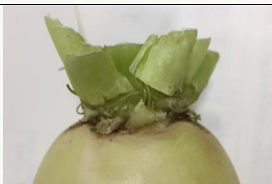
【大根の基準例】 大根は傷んだ葉を根元から2cmを残し切り落としてお届けします。