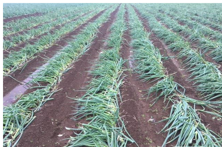
八街産直会(千葉県) ねぎが強風にあおられて折れてしまった。