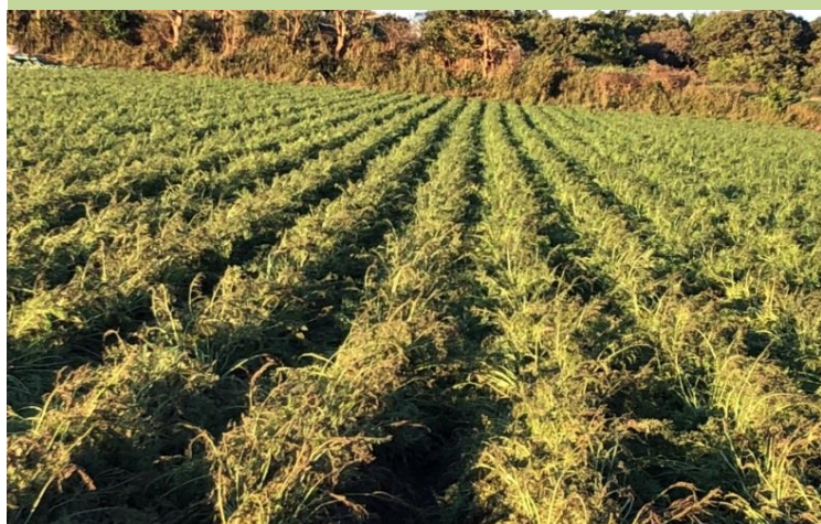
JA ちばみどり海上産直部会(千葉県) 人参も塩害を受けて葉が茶色く変色して来ている。