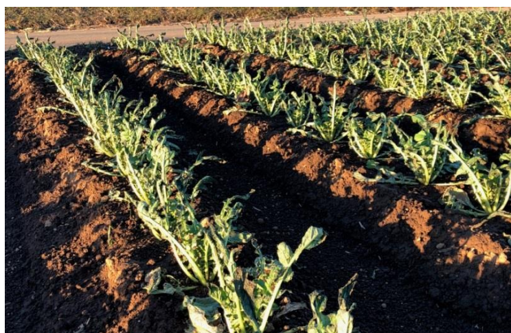
JA ちばみどり海上産直部会(千葉県) 大根は強風にあおられて葉がボロボロに。塩害も発生。