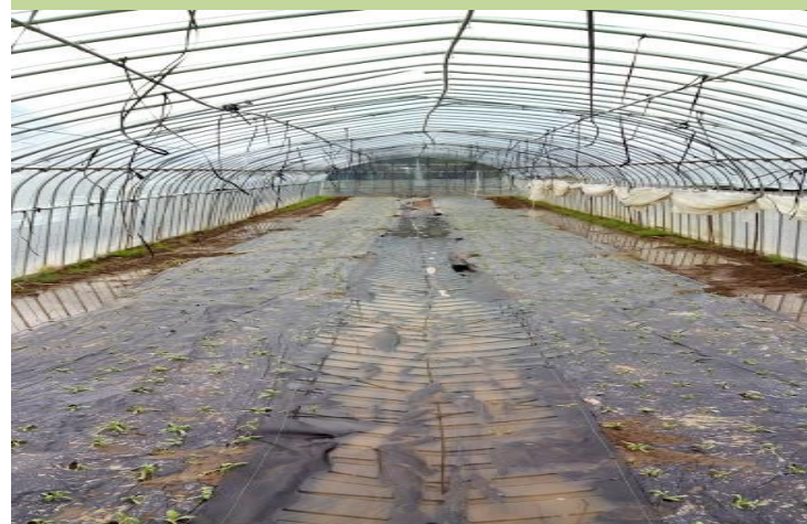
村悟空(千葉県) 春菊のハウスのビニールが破れ水浸しに。