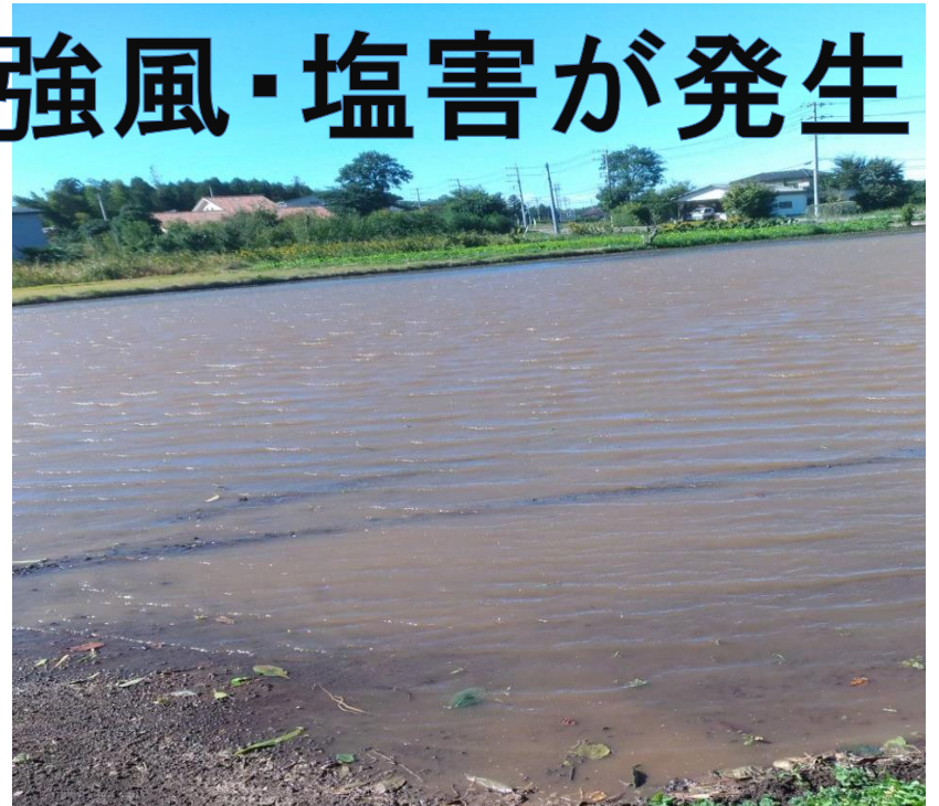
JA つくば市谷田部産直部会(茨城県) サニーレタスは苗の定植を終えていたが、大雨で畑が一面池のようになってしまった。

現在、葉物野菜や大根は種の撒き直しを行っていますが、これからの季節は気温の低下で生長が遅く、さらに塩害の影響を受けた産地では長期的な影響が出る可能性があります。