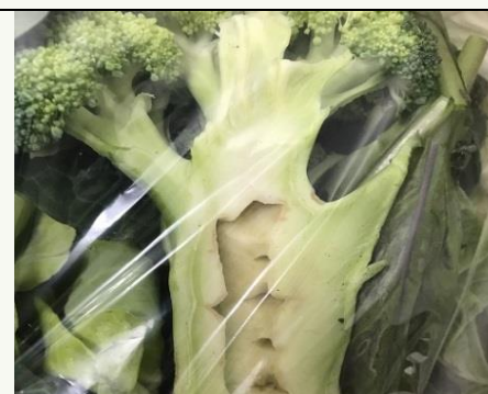
【ブロッコリーの基準例】 内部空洞は変色や軟化を伴わないものはお届けします。