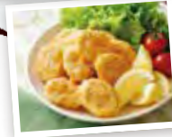
「までっこ鶏 チキンナゲット」

スーパージャーが便利。野菜 や肉など鍋で煮ると時間も かかるし、火から離れられ なくなる。でもスーパージャー にある程度加熱したものを 入れておけば、勝手にやわ らかくなるのでおすめ