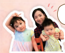
微生物検査担当(育児前) T