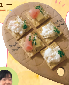
ひとり暮らし 丸橋