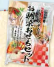
『パルシステムでお馴染みおせち(7品)7種』

実家への土産には必ずパルシステムの冷凍のカニを持って行きます。解凍も簡単で食べやすく、お正月の食卓には欠かせないと喜ばれています！